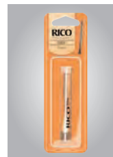
便利なプリスターバック入り

リコのバスーンリードはプレミアムクオリティのケーンから造られた、伝統的なドイツスタイルのリードです。プラスチック製の針金で、ティップ・オープニングを調整できます。