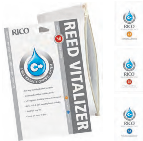
リード・ヴァイタライザーキット 58%